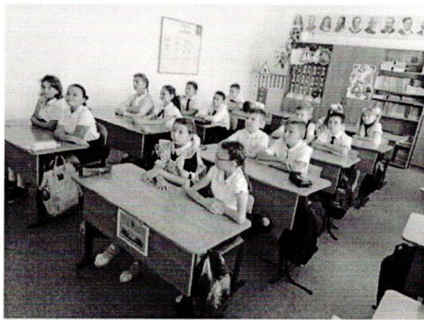
Классный час по представлению информации, найденной в

Практическая значимость состоит в том, что не только дети, но и взрослые понимают необходимость второй жизни каждого листочка бумаги. Понятно, что сбор макулатуры не может полностью решить проблему вырубки лесов. Сохранение зеленых насаждений в лесах, а также уменьшение мусорных свалок зависит от каждого из нас.